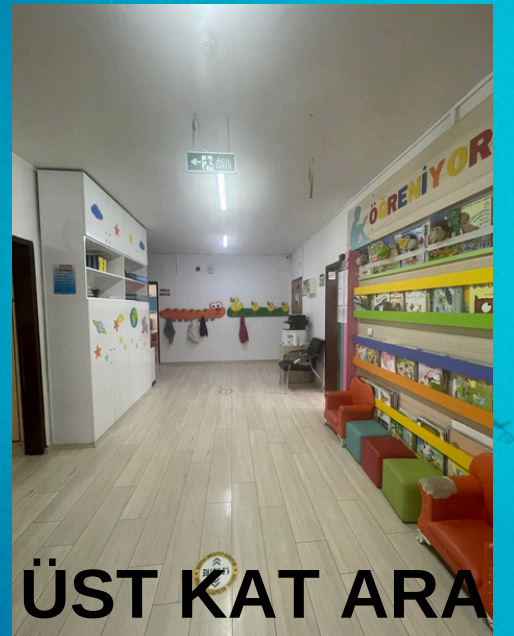
ÜST KAT ARA