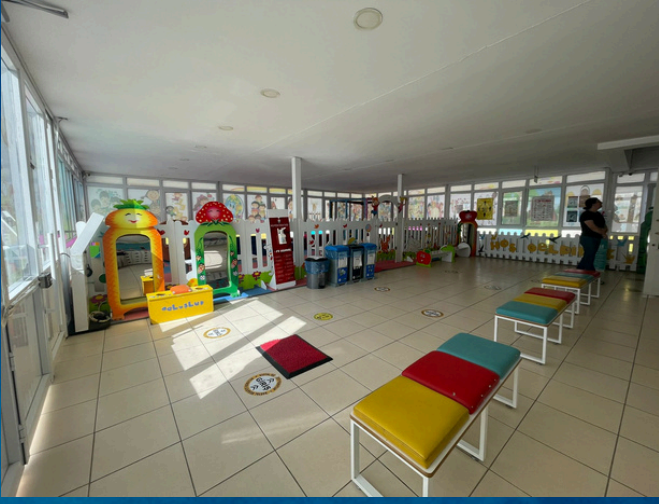
KAPALI OYUN ALANI